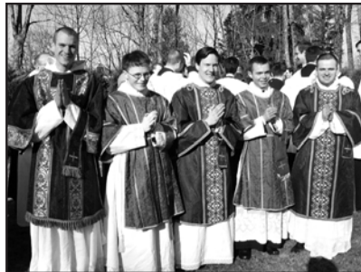
Nos deux nouveaux sous-diacres entourant leurs confrères de la FSSP