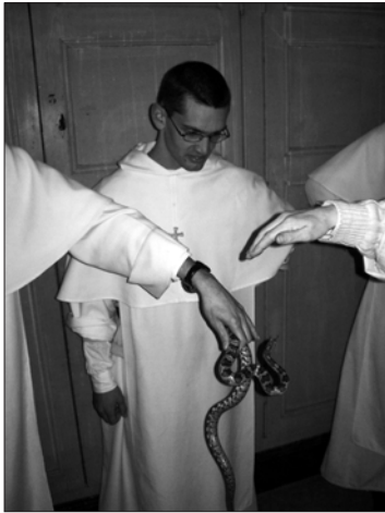
Les frères apprennent à dompter le mensonge

✧ Plusieurs conférences destinées à des lycéens et étudiants sont données mensuellement par de jeunes Frères, à Laval, à Tours, à Paris, et permettent de diffuser une pensée réaliste, thomiste, propre à défier les miasmes idéologiques qui ruinent les intelligences. Au programme de la première : la lettre de Guy Môquet, désintoxication face à l' « histoire obligatoire ».