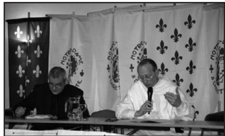
Conférence du Prieur pour les 25 ans de Notre-Dame de Chrétienté

✧ 8 décembre : pour les 25 ans de Notre-Dame de Chrétienté, le Cardinal Castrillon Hoyos vient célébrer une messe pontificale en l'honneur de l'Immaculée Conception à Versailles, en la basilique Sainte-Jeanne-d'Arc trop petite pour accueillir les 2000 fidèles qui s'y pressent. Tous les Pères de notre Communauté ayant des responsabilités dans l'association font le déplacement.