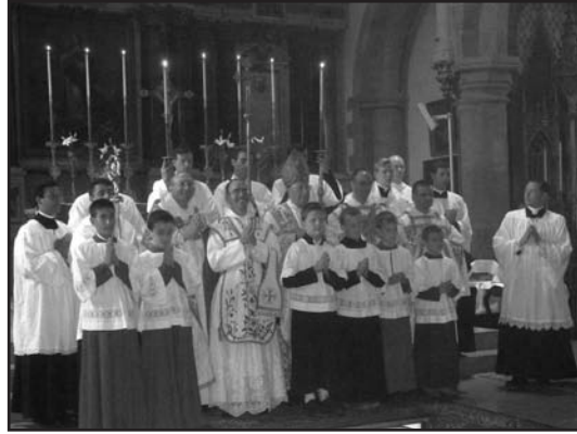
L'évêque, le nouveau prêtre, et les autres !

le Saint-Père à Paris. L'attention des fidèles aux discours que Benoît XVI fait entendre aux Bernardins, à Notre-Dame et aux Invalides révèle la soif d'un enseignement roboratif et orthodoxe, qu'il dispense d'une voix dont la douceur est si marquante.