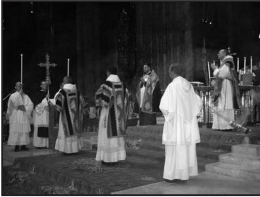
L'évangile à Chartres.