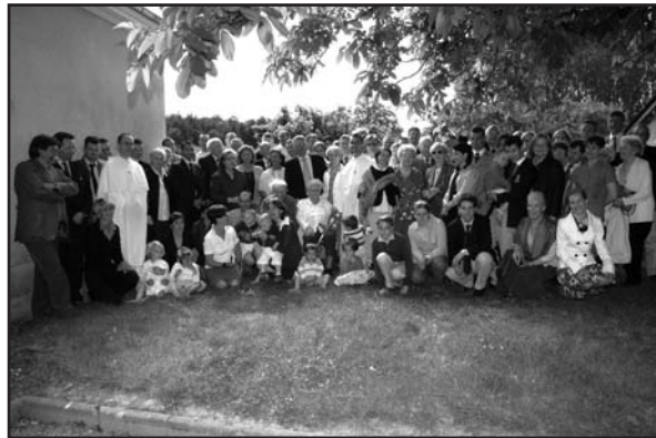
Familles et invités lors des professions perpétuelles.